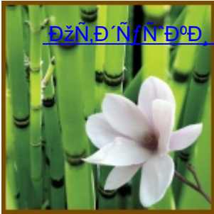
ĐžÑ,Đ´ÑfÑ´Đ°Đ, Đ°Đ 3/4 Ñ•Đ 1/4 ĐµÑ,Đ,Ñ†ĐµÑ•Đ°Đ,Đµ Đ, Đ¿Đ°Ñ€Ñ,,ÑžĐ 1/4 ĐµÑ€Đ 1/2 Ñ<Đµ (31)